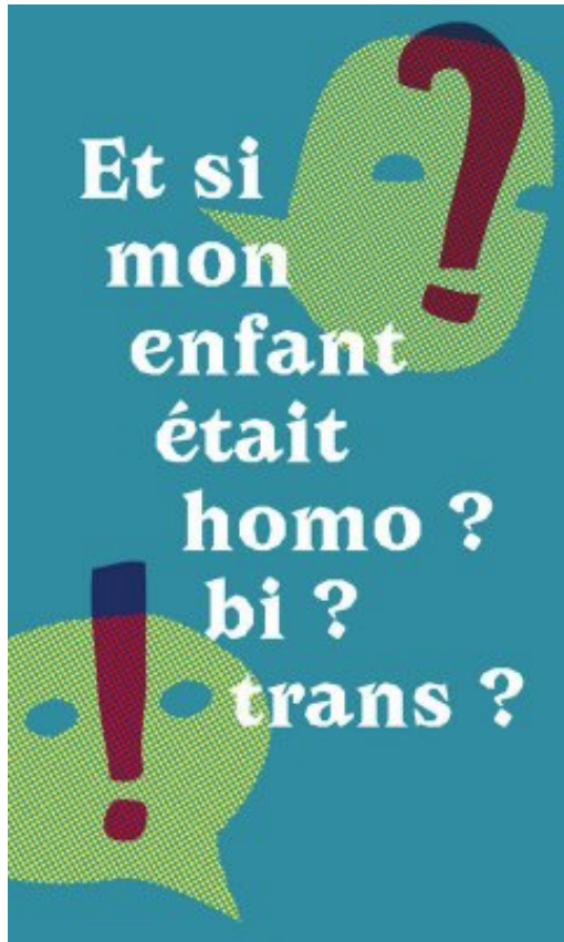
Brochure Contact 44